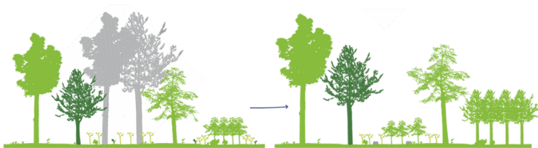
La futaie irrégulière : une coupe réalisée tous les 8 ans environ, pour amener progressivement la forêt vers un mélange équilibré d'arbres de différents âges et tailles.

Au contraire, l'objectif est qu'elles comportent à terme, une proportion équilibrée de jeunes semis, d'arbres adultes et de vieux arbres.