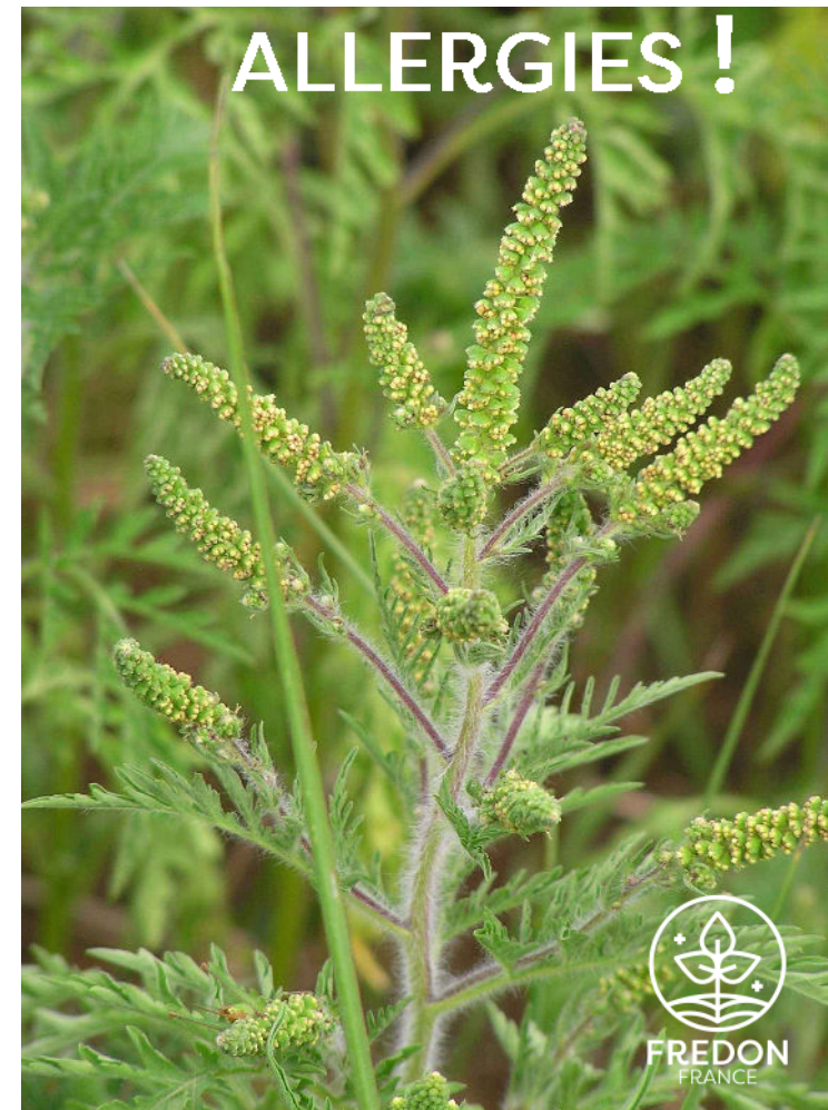
AMBROISIE À FEUILLES D'ARMOISE