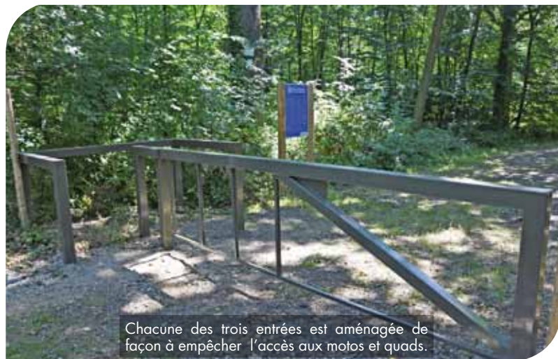
Chacune des trois entrées est aménagée de façon à empêcher l'accès aux motos et quads.