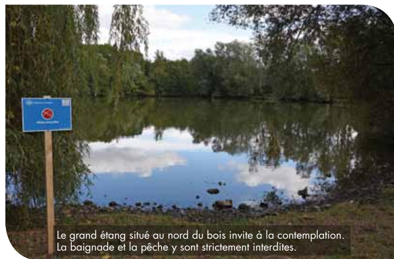
Le grand étang situé au nord du bois invite à la contemplation. La baignade et la pêche y sont strictement interdites.

(1) : Une espèce saproxylique réalise tout ou partie de son cycle de vie dans le bois en décomposition, ou des produits de cette décomposition.