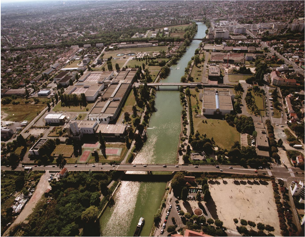
Légende : Vue aérienne de l'usine de Neuilly-sur-Marne

Document en pièce jointe : avis de consultation du public par voie électronique