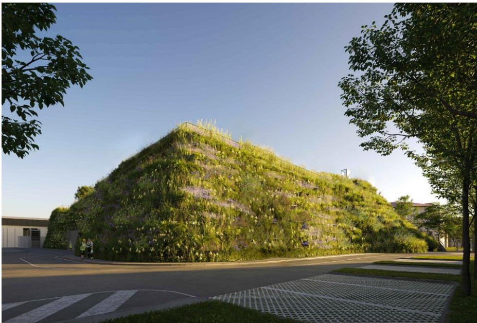
Légende : Vue extérieure du futur hall membranaire (crédit : MVRDV)