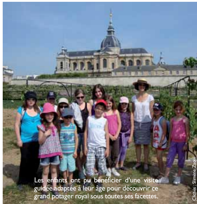
Les enfants ont pu bénéficier d'une visite guidée adaptée à leur âge pour découvrir ce grand potager royal sous toutes ses facettes.