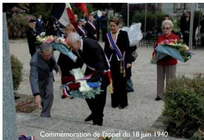
Commémoration de l'appel du 18 juin 1940