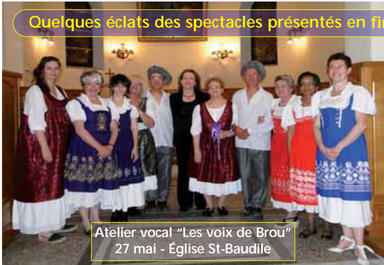
Atelier vocal "Les voix de Brou" 27 mai - Église St-Baudile