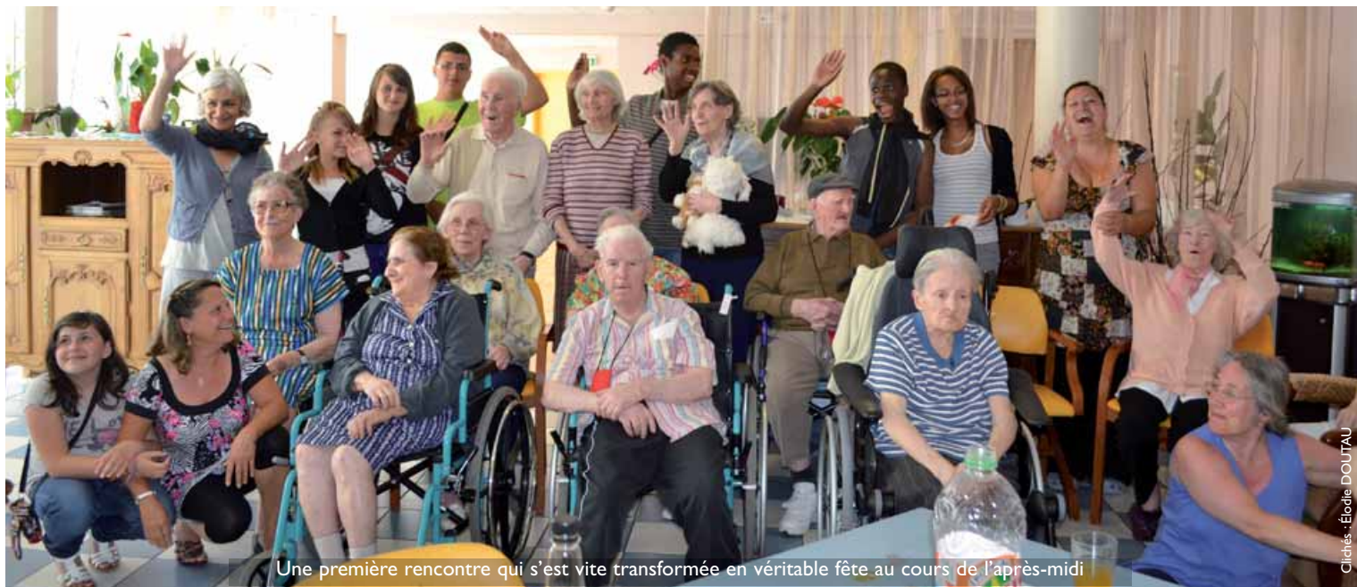
Une première rencontre qui s'est vite transformée en véritable fête au cours de l'après-midi

L'organisation de ce loto "intergénérationnel" a rencontré un vif succès auprès des personnes âgées. Les ados leur venaient en aide pour rappeler les numéros annoncés et placer leurs pions sur les bonnes cases, uniquement si nécessaire.