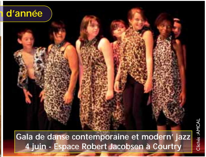
Gala de danse contemporaine et modern' jazz 4 juin - Espace Robert Jacobsen à Courtry