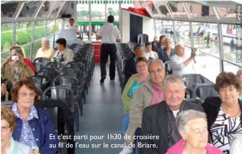
Et c'est parti pour 1h30 de croisière au fil de l'eau sur le canal de Briare.