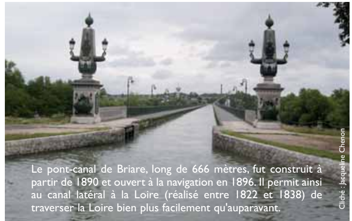
Le pont-canal de Briare, long de 666 mètres, fut construit à partir de 1890 et ouvert à la navigation en 1896. Il permet ainsi au canal latéral à la Loire (réalisé entre 1822 et 1838) de traverser la Loire bien plus facilement qu'auparavant.

par ses belles écluses mais surtout par son remarquable pont enjambant la Loire. Après avoir partagé un bon déjeuner au restaurant, notre équipée profita d'une visite guidée à travers la jolie ville de Briare, puis sur les rives du canal et de la Loire. À la suite de cette agréable promenade digestive, il fut alors temps de remonter dans le car pour regagner Brou dans la soirée. À en croire les commentaires élogieux recueillis sur le chemin du retour, cette sortie, organisée par la commission des personnes âgées, fut très appréciée par l'ensemble des participants.