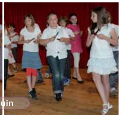
École Romain Rolland - Samedi 25 juin