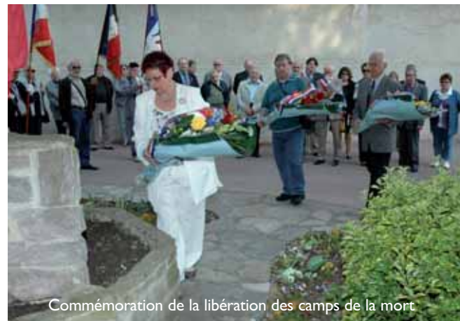
Commémoration de la libération des camps de la mort

Élus locaux, représentants des associations d'anciens combattants, résistants et déportés de Vaires/Brou, mais aussi simples citoyens breuillois se sont rassemblés devant le monument aux morts à trois reprises pour commémorer successivement la libération des camps de la mort (24 avril), la capitulation de l'Allemagne nazie (8 mai) et l'appel historique du Général De Gaulle (18 juin). Des cérémonies du souvenir au cours desquelles il fut prononcé plusieurs discours rendant hommage aux victimes de la barbarie nazie. Résumant assez bien l'exigence du devoir de mémoire pour préserver la paix, nous retiendrons cet extrait de l'allocution prononcée par monsieur le maire lors de la commémoration du 8 mai 1945 : « Nous entendons rendre hommage aux anciens combattants et victimes de guerre, témoigner de notre reconnaissance éternelle à tous ces gens, qui ont agi au nom de la liberté pour un avenir meilleur. Il est essentiel que ce souvenir subsiste pour les générations futures afin qu'elles sachent qui vous étiez et ce que vous avez fait » (texte écrit par René Chenon, conseiller municipal).