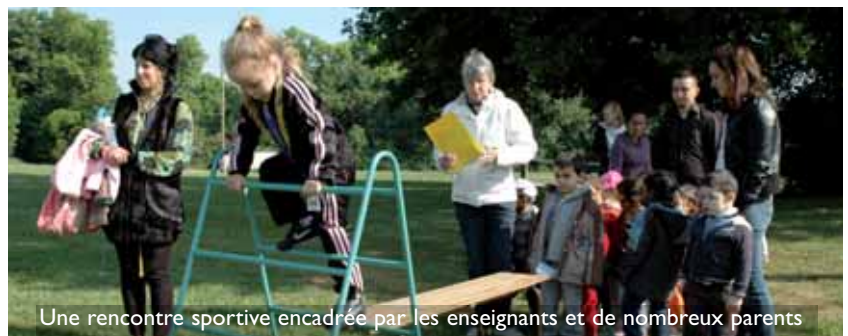
Une rencontre sportive encadrée par les enseignants et de nombreux parents