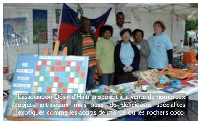
L'association Désir d'Haïti proposait à la vente de nombreux objets artisanaux mais aussi de délicieuses spécialités exotiques comme les accras de morue ou les rochers coco