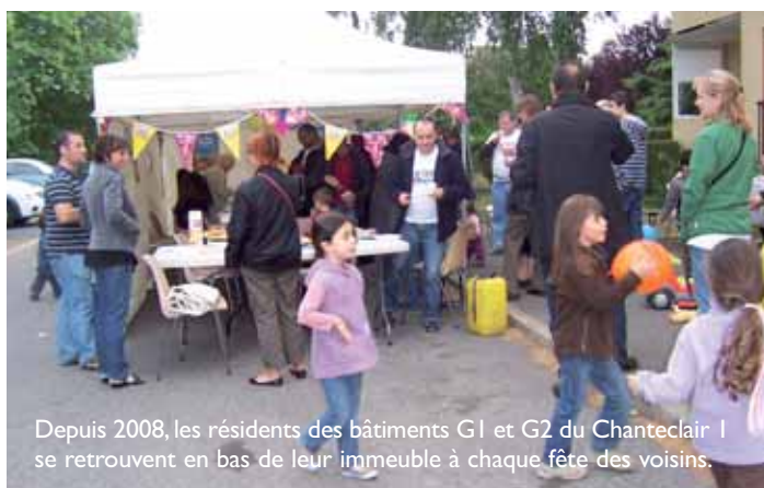
Depuis 2008, les résidents des bâtiments G1 et G2 du Chanteclair 1 se retrouvent en bas de leur immeuble à chaque fête des voisins.

dans des conditions plus fraîches et nuageuses le jour J. Ces manifestations conviviales qui resserrent les liens entre habitants sont vivement encouragées par la municipalité qui mettait de nouveau à disposition chaises, tables et barnums. Les participants ont pu aussi profiter d'affiches, invitations, tee-shirts, ballons gonflables, pains de mie et tablettes de chocolat fournis par l'association "Immeubles en fête" à laquelle la Ville adhère depuis l'an dernier.