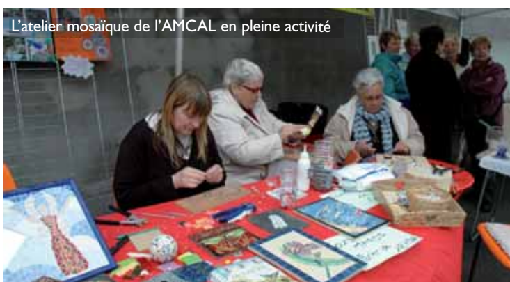
L'atelier mosaïque de l'AMCAL en pleine activité