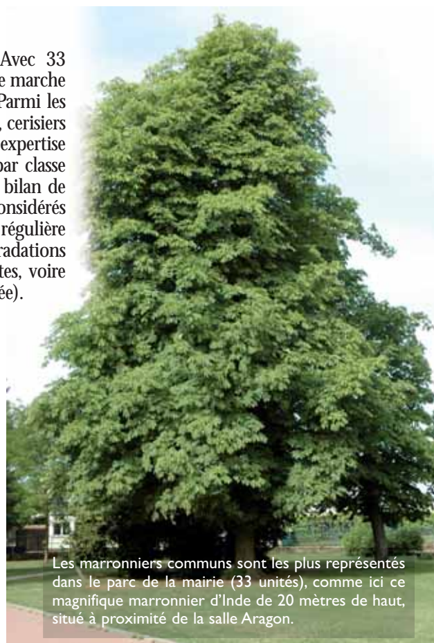
Les marronniers communs sont les plus représentés dans le parc de la mairie (33 unités), comme ici ce magnifique marronnier d'Inde de 20 mètres de haut, situé à proximité de la salle Aragon.