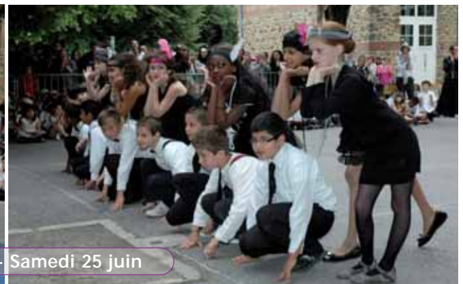
École Jean Jaurès - Samedi 25 juin