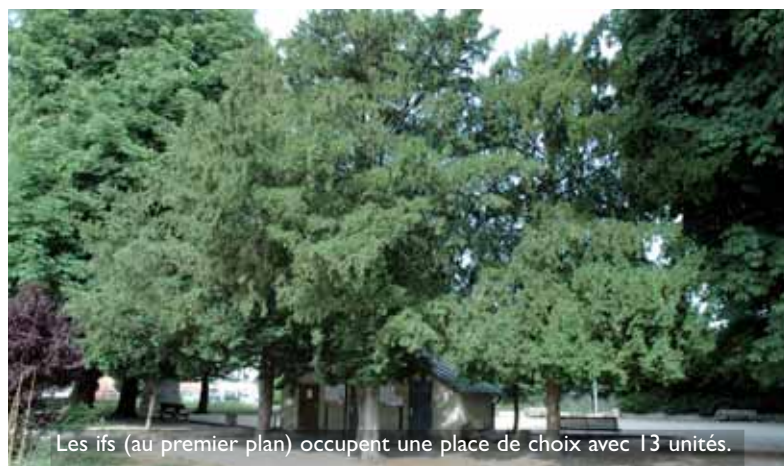
Les ifs (au premier plan) occupent une place de choix avec 13 unités.

Les 162 arbres recensés par l'ONF sont répartis en 44 essences. Avec 33 représentants, c'est le marronnier commun qui monte sur la plus haute marche du podium, suivi par le tilleul commun (16) et l'érable sycomore (15). Parmi les autres variétés, on notera la présence d'ifs, acacias, chênes, cèdres du Liban, cerisiers du Japon, platanes, alisiers, frênes, houx ... Sur l'ensemble du parc, l'expertise révèle une bonne diversité, que ce soit en terme d'essence, répartition par classe d'âge et hauteur des arbres (de 3 à 26 mètres pour les plus anciens). Le bilan de l'état sanitaire général est contrasté. Si la moitié des 162 arbres sont considérés comme sains et sans défaut notable, 32% méritent une surveillance régulière (branches mortes, maladies, champignons...) et 17% présentent des dégradations majeures qui obligeront à des traitements de fond, des tailles conséquentes, voire des abattages dans les cinq années à venir (8 abattages à réaliser cette année).