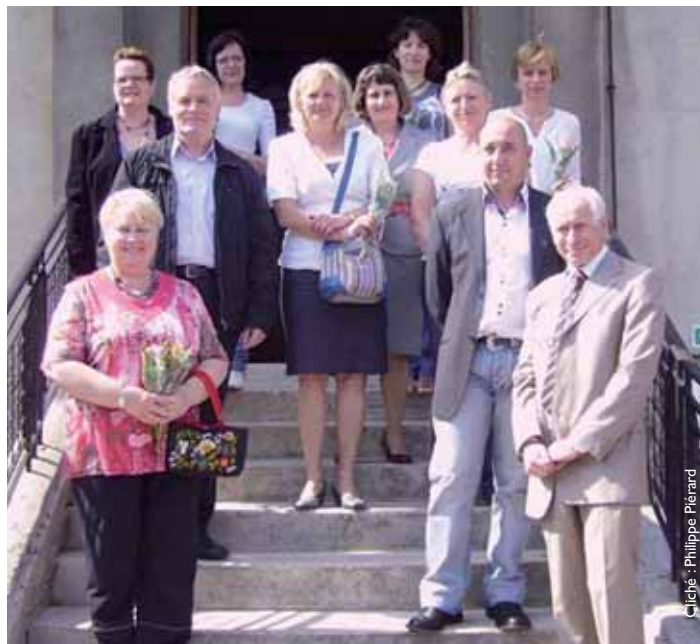
Les médaillés du travail présents le 1 er mai 2011, en compagnie de monsieur le maire.