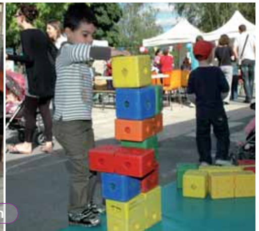
École Danièle Casanova - Vendredi 24 juin