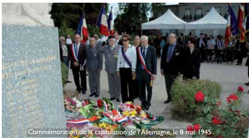
Commémoration de la capitulation de l'Allemagne, le 8 mai 1945