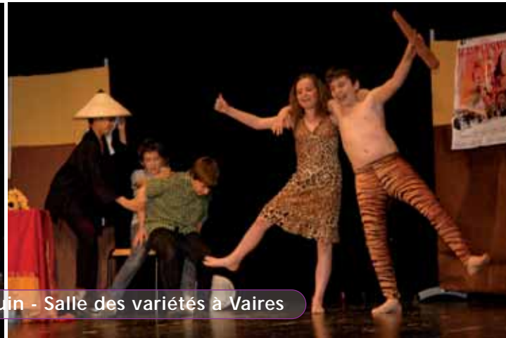
Collège Jean Jaurès - Jeudi 16 juin - Salle des variétés à Vaires