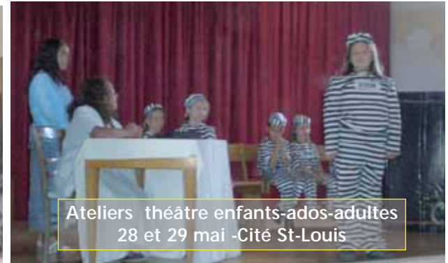
Ateliers théâtre enfants-ados-adultes 28 et 29 mai - Cité St-Louis