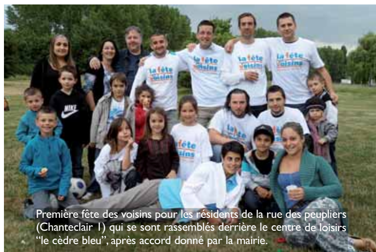
Première fête des voisins pour les résidents de la rue des peupliers (Chanteclair 1) qui se sont rassemblés derrière le centre de loisirs "le cèdre bleu", après accord donné par la mairie.