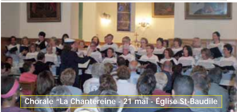
Chorale "La Chanteraine" - 21 mai - Église St-Baudile