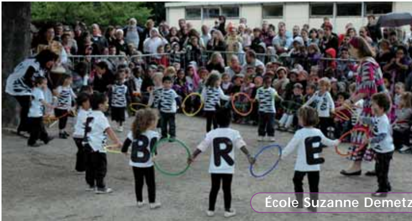
École Suzanne Demetz - Samedi 18 juin

Nous vous offrons ici quelques regards sur les spectacles, kermesses et autres animations qui ont achevé cette fin d'année scolaire en véritables moments de fêtes partagés entre équipes enseignantes, élèves et parents.