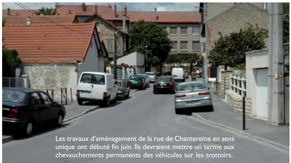
Les travaux d'aménagement de la rue de Chantereine en sens unique ont débuté fin juin. Ils devraient mettre un terme aux chevauchements permanents des véhicules sur les trottoirs.

Les travaux de réfection de la rue des roses (entre la rue Carnot et la rue des bleuets) vont débuter début juillet. Cette réfection de chaussée sera suivie d'une réfection partielle de la rue des bleuets et de la rue Joffre (devant l'entrée de l'école J. Jaurès).