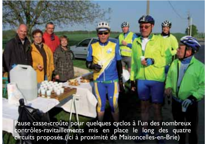
Pause casse-croûte pour quelques cyclos à l'un des nombreux contrôles-ravitaillements mis en place le long des quatre circuits proposés (ici à proximité de Maisoncelles-en-Brie)

9 allée du bourrelier, 77500 Chelles. Tél. 01 64 21 13 37