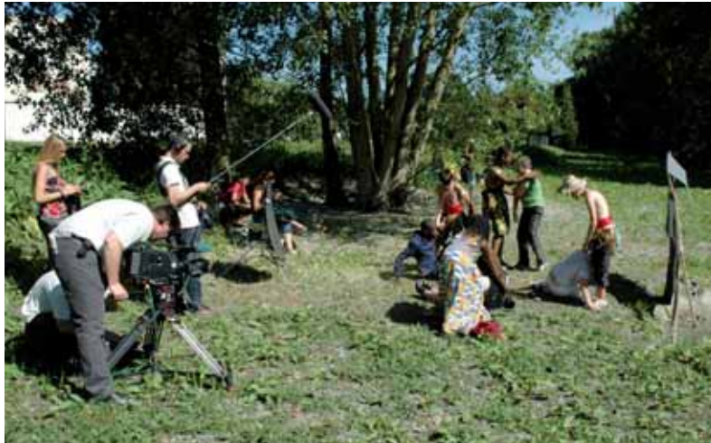
Silence, on tourne ! Les jeunes du CLEJ en plein tournage, le mercredi 19 mai au complexe Marcel PAUL (à proximité du ru de Chantereine).

Eaux d'Ile-de-France (SEDIF (1) ). Bonne inspiration car leur story-board sur le thème de la récupération des eaux de pluie a été placé en tête des quatre projets retenus dans la catégorie d'âge CM2 (10-12 ans). Une première place qui leur a permis de réaliser un mini film intitulé "L'eau de pluie, c'est la vie".